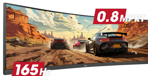
165Hz & 0.8ms MPRT

Sa brzinom osvežavanja od 165 Hz i vremenom odziva MPRT od 0,5 ms, sila je sa vama! Donesite odluke u deliću sekunde i budite sigurni da je slika na ekranu uvek oštra i glatka.