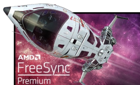
Technologie FreeSync™ Premium

La dalle en technologie Fast IPS à 240 Hz garantit des scènes de champ de bataille vives, haute fidélité d'affichage avec des couleurs exceptionnellement précises et offre un temps de réponse d'image animée (MPRT) époustoufflant de 1 ms.