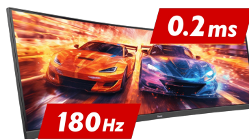
180Hz & 0.2ms MPRT

La dalle Fast IPS garantit non seulement des scènes de champ de bataille vives et de haute fidélité affichées avec une précision de couleur exceptionnelle, mais elle offre également un temps de réponse d'image en mouvement (MPRT) exceptionnel de 0.2 ms.