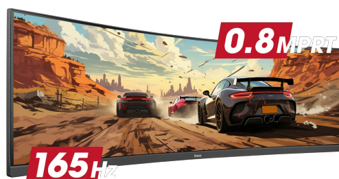
165Hz & 0.8ms MPRT

Les moniteurs ultra larges au format 32:9 dotés de la résolution DQHD 5120 x 1440, également connue sous le nom de Dual QHD, offrent des images d'une netteté exceptionnelle qui donnent vie à vos jeux. Ces moniteurs vous permettent d'organiser votre station gaming pour une expérience de jeu inégalée. Vous ne manquerez aucun détail !