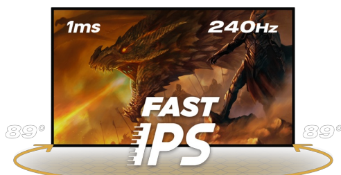
240Hz & 1ms MPRT

La dalle en technologie Fast IPS garantit une superbe qualité d'image, et la possibilité de régler la luminosité et les nuances sombres avec la fonction Black Tuner offre de meilleures performances de visualisation dans les zones ombragées. Pour assurer le confort pendant les sessions de jeu marathon, vous pouvez facilement ajuster la position de l'écran selon vos préférences grâce au support réglable en hauteur.