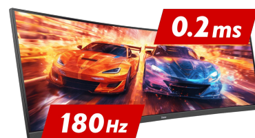
180Hz & 0.2ms MPRT

La dalle Fast IPS garantit non seulement des scènes de champ de bataille vives et de haute fidélité affichées avec une précision de couleur exceptionnelle, mais elle offre également un temps de réponse d'image en mouvement (MPRT) exceptionnel de 0.2 ms.